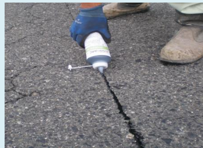
(ボトル式携帯用簡易充填剤)